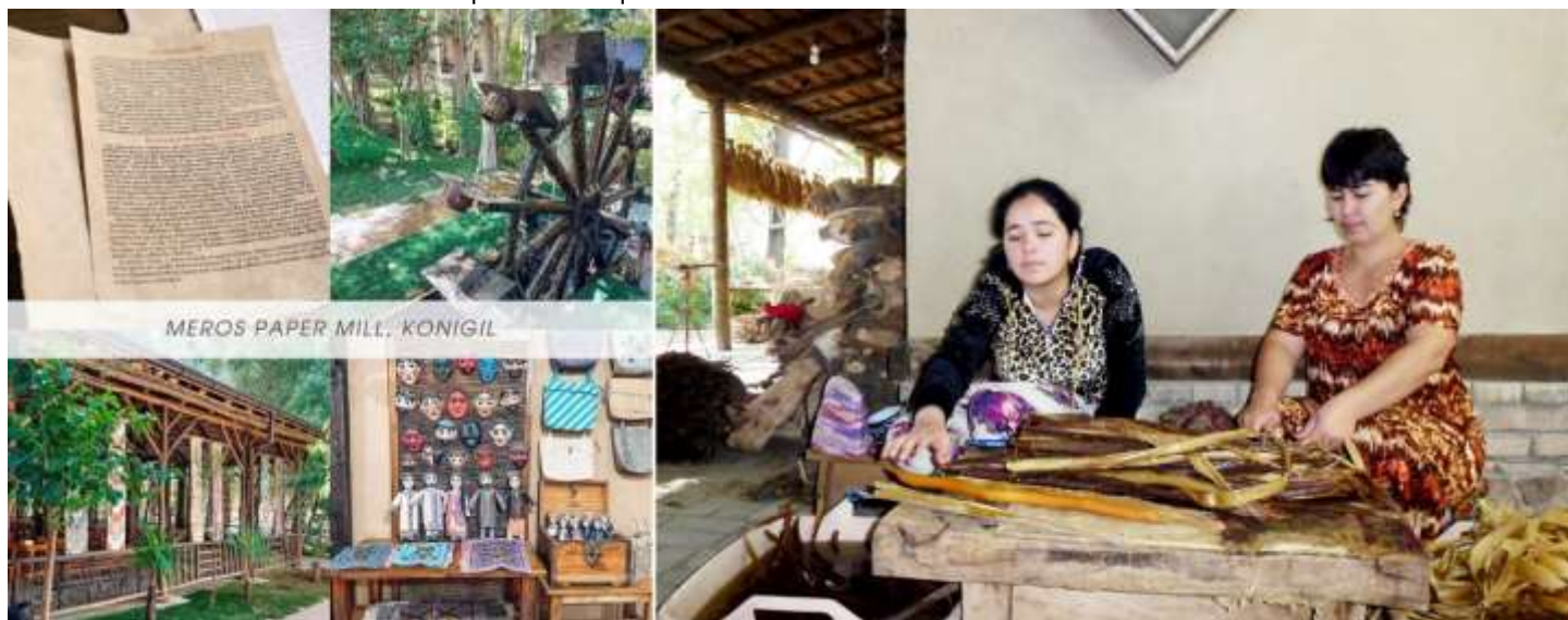
MEROS PAPER MILL, KONIGIL