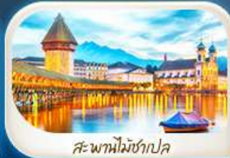
สะพานไม้อู๋ชาเปล