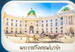
พระราชวังฮอฟบวร์ก

12-18 มี.ค.68 / 19-25 มี.ค.68 28 เม.ย. - 4 พ.ค.68 7-13 พ.ค.68