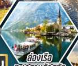
รถไฟ ทะเลสาบอัลสติก