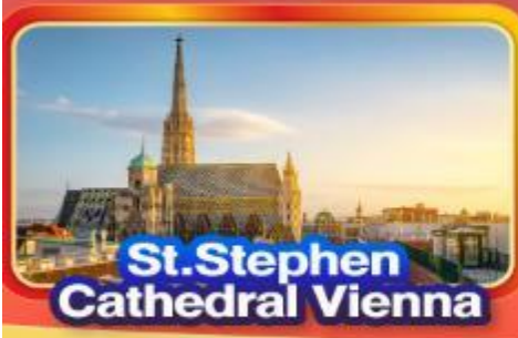
St. Stephen Cathedral Vienna