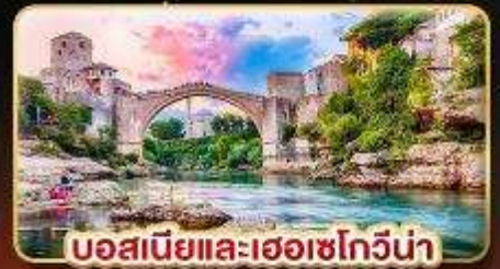
บอสเนียและเฮอร์เซโกวีนา