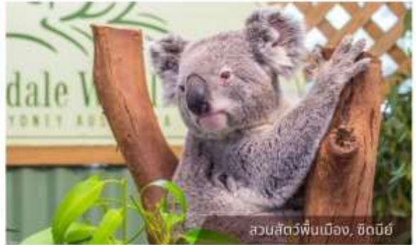
สวนสัตว์ฟินเมือง, ซิดนีย์