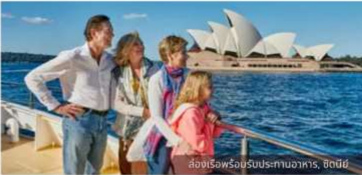
ล่องเรือพร้อมรับประทานอาหาร, ซิดนีย์