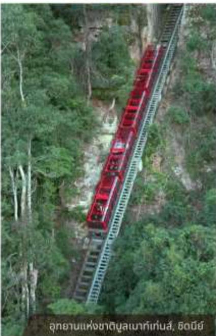
อุทยานแห่งชาติบลูเมาท์เท็นส์, ซิดนีย์