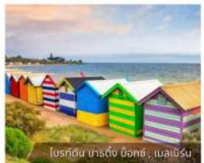
โบสถ์ต้นน้ำ, ซิดนีย์, เมลเบิร์น