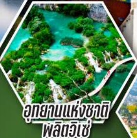
อุทยานแห่งชาติ พลิตวิเซ