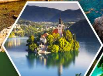
ทะเลสาบพลอด