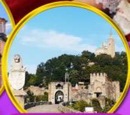
ป้อมชาเรเวทส์