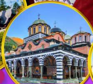
อารามมรดกโลกริลา