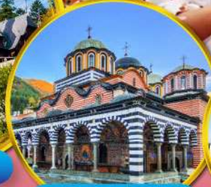
อารามมรดกโลกริลา