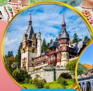
ปราสาทเปเลส