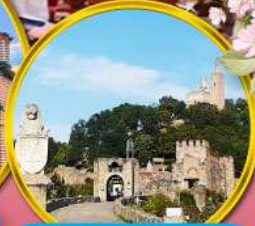
ป้อมชาเรเวทส์