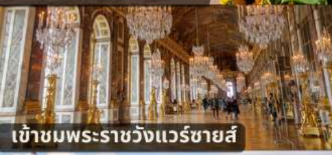
เข้าชมพระราชวังแวร์ซายส์