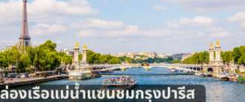
ล่องเรือแม่น้ำแซนชมกรุงปารีส