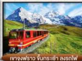
เขา Jungfrau ขึ้นกระเช้า ลงรถไฟ