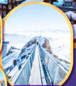
ยอดเขา กลาซีเยร์ 3000