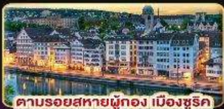
คาบรอยสหายผู้ทอง เมืองซูริค

📱 พักซูริค 2 คืนติด พักอินเทอลากั้นท์ 2 คืนติด