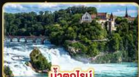
น้ำตกโรน