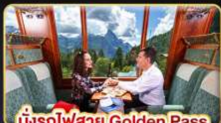
นั่งรถไฟสาย Golden Pass