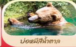
ปอแตมีสีน้ำตาค