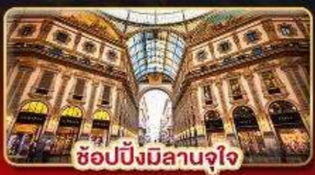
ช้อปปิ้งมิลานจุใจ