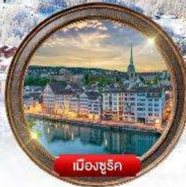
เมืองซูริก