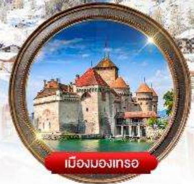
เมืองมงเทรซ