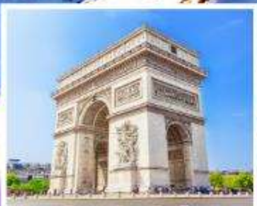
ประตูลีปารีส