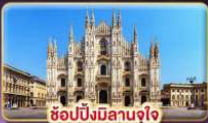
ช้อปปิ้งมิลานจุใจ