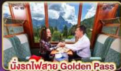
นั่งรถไฟสาย Golden Pass