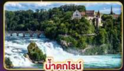
น้ำตกไรน์