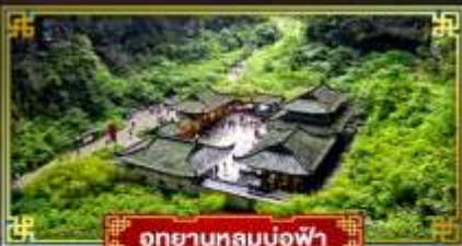
อุทยานหลุมฟ้า

“ฉงชิ่ง” มหานครสุดอลัง เมืองมรดกโลก อุทยานแห่งชาติหลุมฟ้า 3 สะพานสวรรค์