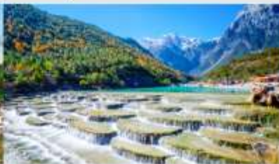
ทะเลสาบไป๋สุ่ยเหอ