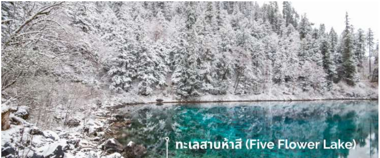
ทะเลสาบห้าสี (Five Flower Lake)

หนึ่งในจุดที่สวยงามและนักท่องเที่ยวแห่มาเยี่ยมชมเยอะที่สุด ตั้งอยู่ที่ความสูงเหนือระดับน้ำทะเลประมาณ 2,472 เมตร น้ำลึกประมาณ 5 เมตร น้ำใสจนเห็นพื้นด้านล่างของทะเลสาบ สีของผิวน้ำสวยงามแปลกตา โดยเฉพาะเมื่อยามแสงอาทิตย์สาดส่องกระทบผิวน้ำ สีของน้ำในทะเลสาบจะสะท้อนเป็นสีส้มถึง 5 เฉดสี สวยงามสะกดตา ซึ่งสาเหตุที่ทำให้เกิดสีสันต่างๆ นี้มาจากการสะสมของแร่ธาตุ และพืชน้ำชนิดต่างๆ โดยจะมีสีสันแตกต่างกันไปตามฤดูกาลและ