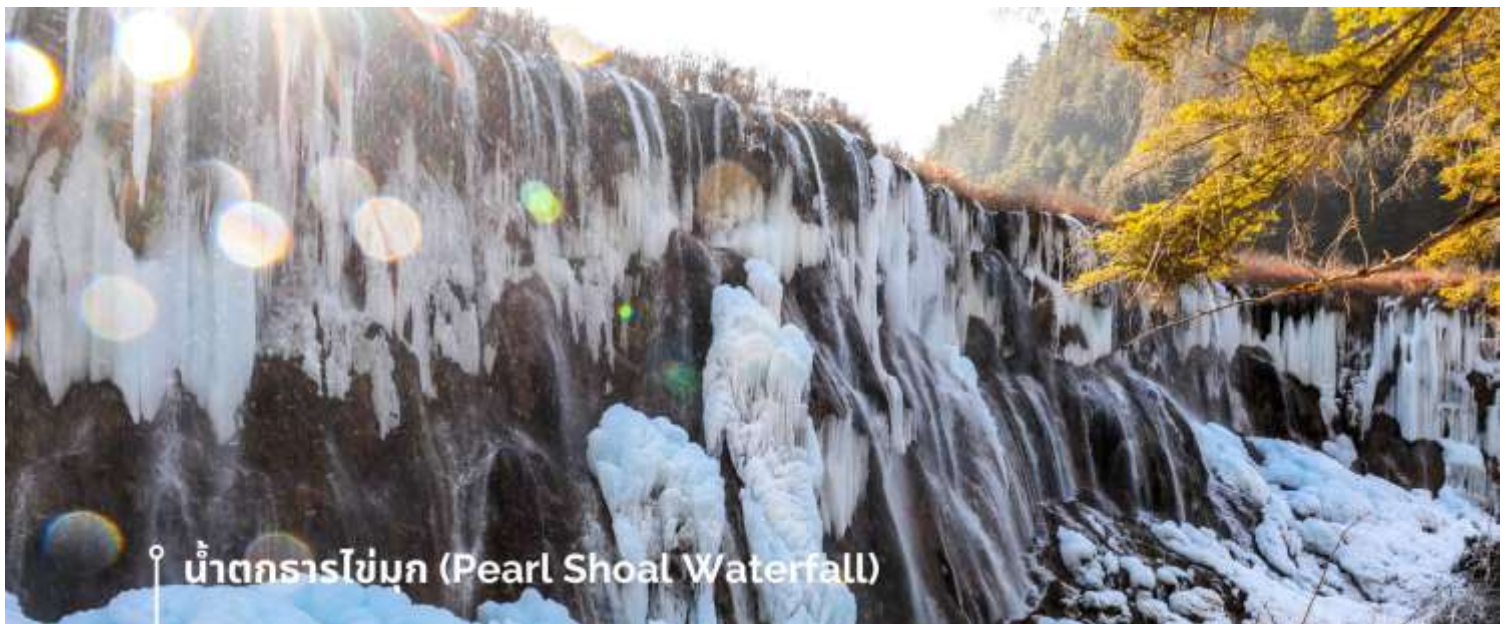
น้ำตกธารไข่มุก (Pearl Shoal Waterfall)

หรือ น้ำตกบูริออลาง (Nuo Ri Lang Waterfall) ถือเป็นน้ำตกที่ใหญ่ที่สุดในจิวจ้ายโกว มีความสูง 40 เมตร กว้าง 310