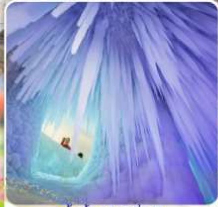
ถ้ำน้ำแข็งหมื่นปี