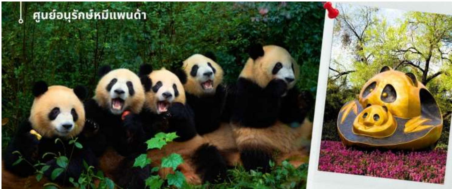
ศูนย์อนุรักษ์หมีแพนด้า

จากนั้นนำท่านชม ศูนย์อนุรักษ์หมีแพนด้า (รวมรถลอล์ฟ) เมืองเฉิงตู มณฑลเสฉวนแห่งนี้เป็นแหล่งต้นกำเนิด และเป็นเมืองที่ขึ้นชื่อว่ามีแพนด้า ที่เยอะที่สุดในโลกก็ว่าได้ ศูนย์อนุรักษ์หมีแพนด้า Chengdu Giant Panda Breeding Research Base ถูกจัดตั้งจากทางรัฐบาลจีนตั้งแต่ปี ค.ศ. 1987 เนื่องจากทางการได้เห็นถึงการเปลี่ยนแปลงจำนวนของประชากรน้องหมีแพนด้าที่มีจำนวนลดลงอย่างต่อเนื่อง โดยจากสถิติเมื่อปี ค.ศ. 1984 มีจำนวนประชากรหมีแพนด้าอยู่ในธรรมชาติประมาณแค่ 1,500 ตัวเท่านั้น จึงได้เกิดการก่อตั้งศูนย์แห่งนี้ เพื่อเป็นการช่วยดูแล รักษาประชากรหมีแพนด้า โดยนอกจากการดูและน้องแพนด้าแล้ว ยังมีการดูแลสัตว์ป่าใกล้สูญพันธุ์อีกหลายสายพันธุ์ เช่นแพนด้าแดง ถึง