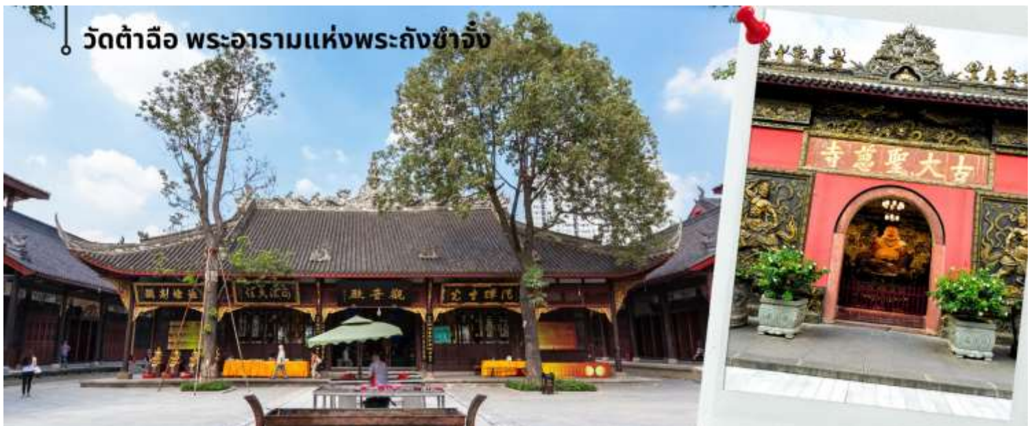
วัดต้าฉือ พระอารามแห่งพระถังซำจั๋ง

นำท่านชม วัดต้าฉือ (พระอารามแห่งพระถังซำจั๋ง) ในกลางนครเฉิงตู พระถังซำจั๋ง ได้รับการสรรเสริญว่าเป็นผู้มีความเพียร และมีชื่อเสียงมายาวนานกว่า 1,400 ปี และยังได้รับการยกย่องว่าเป็น พระไตรปิฎกแห่งราชวงศ์ถัง พุทธประวัติของพระถังซำจั๋งถูกจารึกในสถานที่ต่างๆ มากมาย รวมไปถึงได้ถูกกล่าวถึงในจดหมายเหตุหลายเล่ม ตามเส้นทางการเดินทางแห่งความเพียรของท่าน รวมทั้งมีพระอัฐิของท่าน ประดิษฐานอยู่ในพระอารามของนครนานจิง และที่ทะเลสาบสุรียันจันทรเป็นเกาะได้วันอีกด้วย