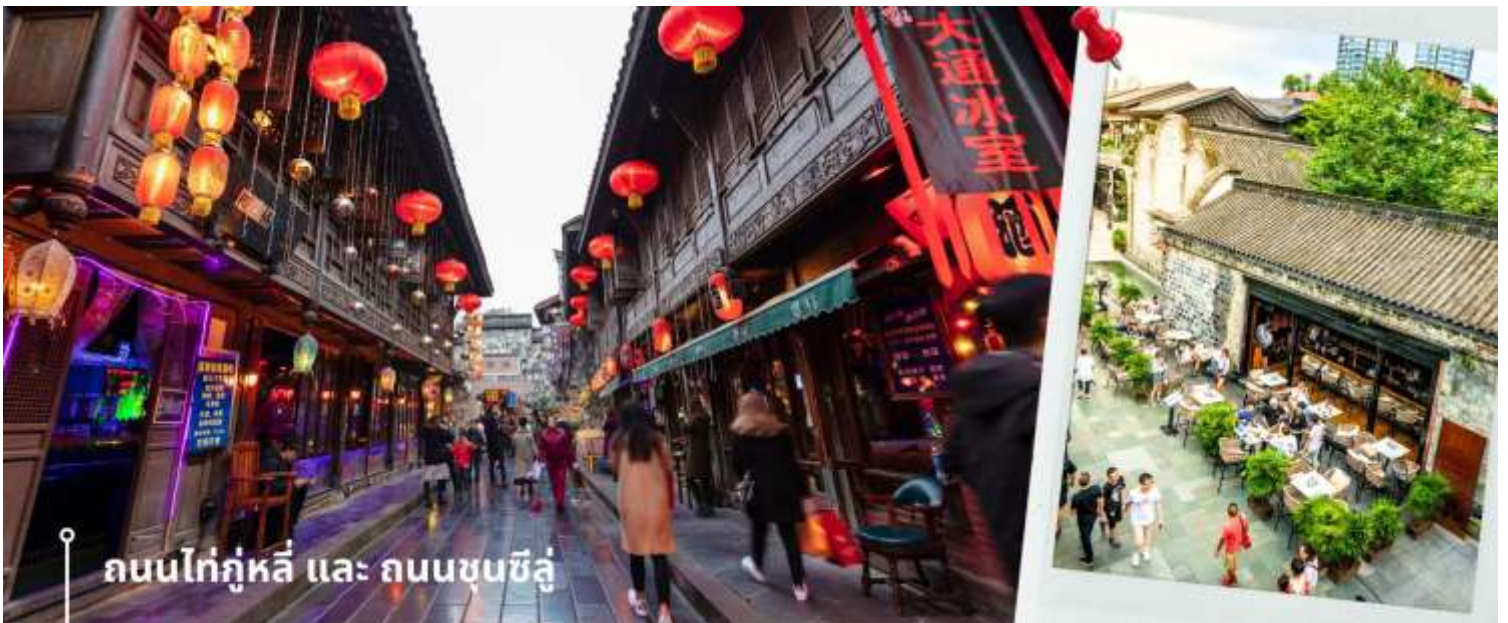
ถนนไท่กู่หลี่ และ ถนนชุนซิลู่

ชมสะพานโบราณอันชุน-พร้อมชมแสงสียามค่ำคืน ตึกแฝดเทียนฟู่ เป็นสะพานข้ามคลองที่สร้างเป็นเหมือนอาคารอยู่ข้างบน ในช่วงเวลายามเย็นจะเป็นช่วงที่ผู้คนออกมาชมบรรยากาศบริเวณของสะพานแห่งนี้ และมีร้านค้ามากมาย รวมไปถึงบาร์เครื่องดื่มต่างๆ ที่ดึงดูดนักท่องเที่ยวได้เป็นอย่างดี เป็นสะพานที่ทอดข้ามแม่น้ำจินเจียง และเป็นรูปแบบสะพานมีหลังคา ตามลักษณะสถาปัตยกรรมจีนโบราณ อายุมากกว่า 300 ปี และในบริเวณใกล้เคียงกัน ยังเป็นที่ตั้งของ ตึกแฝด