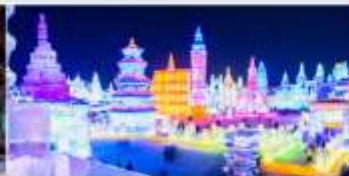
เทศกาลโคมไฟน้ำแข็ง