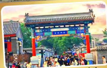
ถนนโบราณหนานหลวู่กุ่ชียง