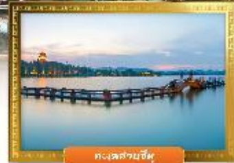
ทะเลสาบอู๋