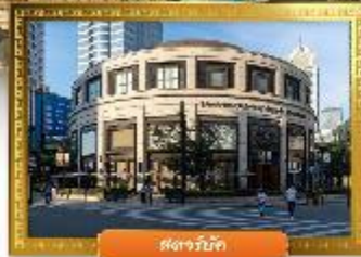
ตงจางมิก

☑️ ซื้อบิง POP MART ถ่ายรูปคู่กันคิมอีคัง