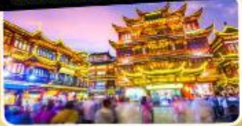
ตลาดร้อยปีเจิ้งหวงเหมียว