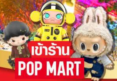
เข้าร้าน POP MART