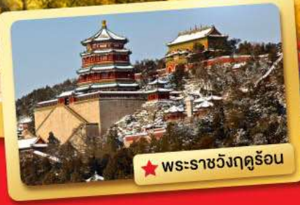
★ พระราชวังฤดูร้อน