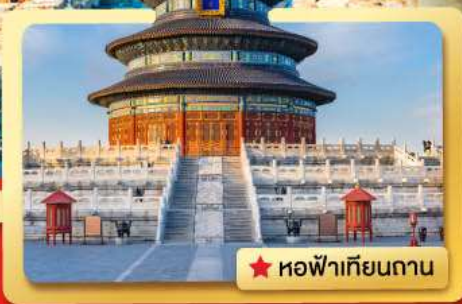
★ หอฟ้าเทียนถาน

เที่ยวเมืองหลวงของประเทศจีน.. ชมประวัติศาสตร์ที่ยิ่งใหญ่ พบกับ..อารยธรรมเก่า.. ความเจริญของยุคปัจจุบัน.. ที่ผสมผสานกันอย่างลงตัว