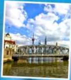
สะพานไว๋ปายตุ้เจียว