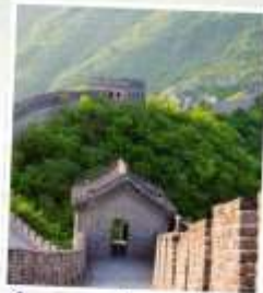
กำแพงเมืองจีนด่าน จหยงกวน