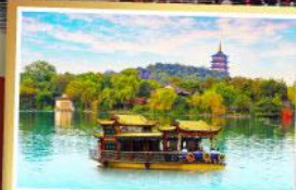
ล่องเรือทะเลสาบซีหู