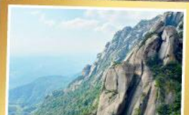
เขาหลงซาน