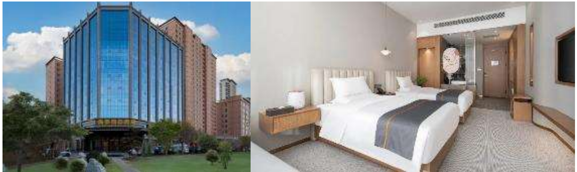
หรือ ZHANGYE MINGJIALE INTERNATIONAL HOTEL หรือ เทียบเท่า 4 ดาว Opened: 2022