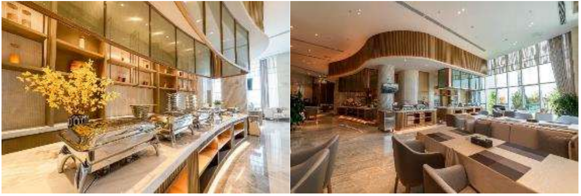
หรือ ZHANGYE SHANGJING HOLIDAY HOTEL หรือ เทียบเท่า 4 ดาว #2 of 4-star Select Hotels in Zhangye / Opened: 2022