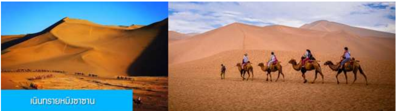
เนินทรายหมิงซาซาน

พักที่ REZEN HOTEL ระดับ 4 ดาวท้องถิ่นหรือเทียบเท่าในเมือง เจียยวี่กวน