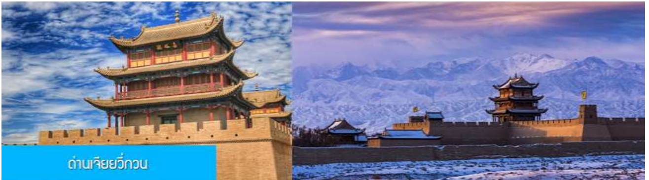
ด่านเจียยวี่กวน