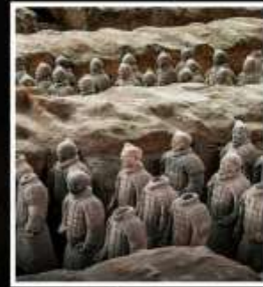
พิพิธภัณฑ์กองทัพใต้ดิน ทหารม้าจีนซี