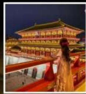
ท่าแพงอังก์เทียนเหมิน