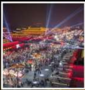
ถนนคนเดินวัฒนธรรมต้าถิง