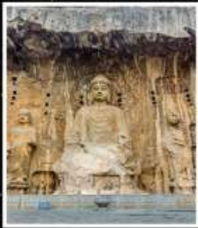
พระพุทธรูปแกะสลัก หินหลงเหมิน