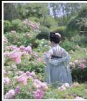
เทศกาลดอกโบตั๋น