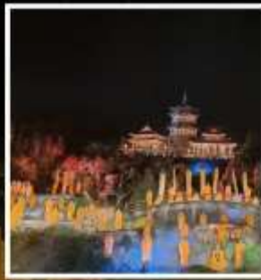
โชว์ SHAOLIN MUSIC CEREMONY