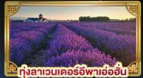
ทุ่งลาเวนเดอร์อิฟาอ้อฮิน