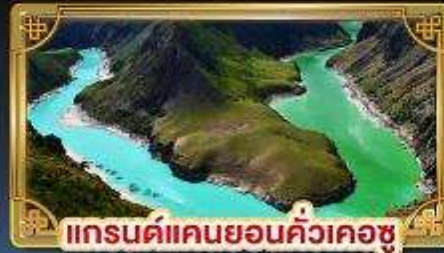
แกรนด์แคนยอนคิ้วเคอซู