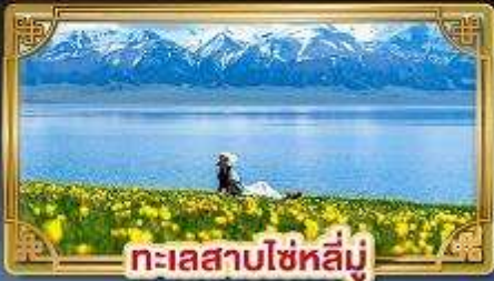
ทะเลสาบไซหลิน