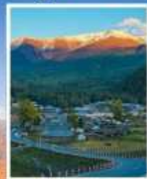
หมู่บ้านไปฮาปา