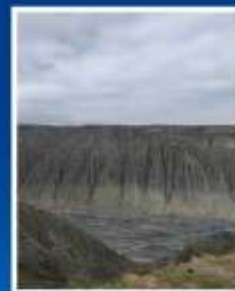
แกรนด์แคนยอน ตู้ซานจื่อ