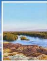
ธารน้ำ 5 สี