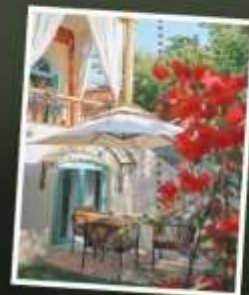
หมู่บ้านคางจันฉี