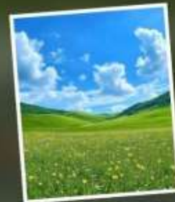
ทุ่งหญ้าแห่งท้องฟ้า