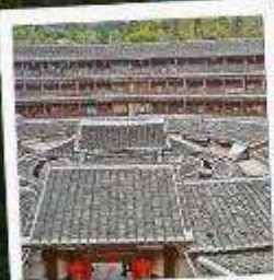
บ้านดินหย่งตั้ง