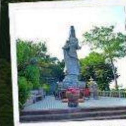
ศาลเจ้าแม่ทับทิม