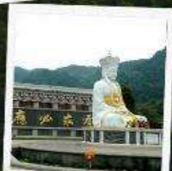
เทพเจ้าโจวซ็อกง