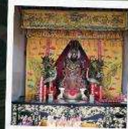
ศาลเจ้าเฮียงมู่ซิว