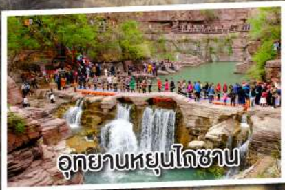
อุทยานหยุ่นโกซาน