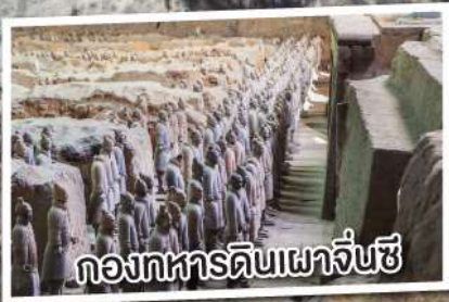
กองทัพดินเผาจิ๋นซี