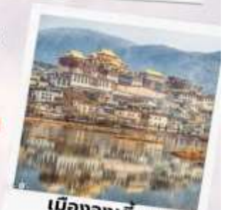
เมืองจางเตี้ยน แชงกรีล่า