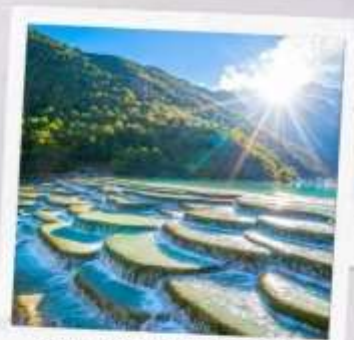
หุบเขาพระจันทร์ สีน้ำเงิน