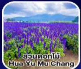
สวนดอกไม้ Hua Yu Mu Chang