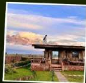
YUN DI AN CAFE