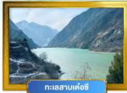
ทะเลสาบเค่อซี