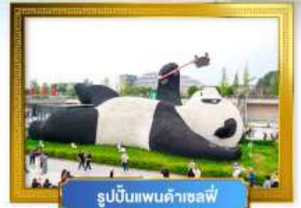
รูปปั้นแพนด้าเซฟี่