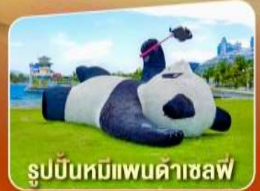
รูปปั้นหมีแพนด้าเซลฟ์