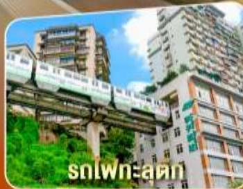
รถไฟทะลุดัก