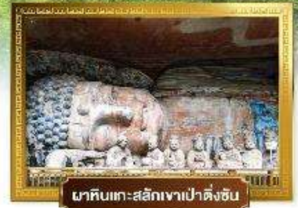
พาศิลปะสลักเขาเป่าต้งซัน