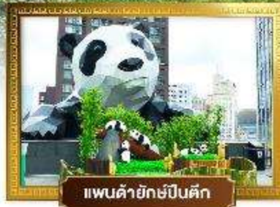
แพนด้ายักษ์ปิ่นตึก