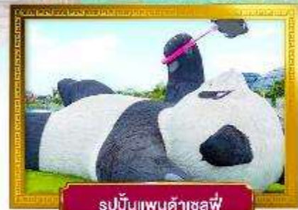
รูปปั้นแพนด้าเซลฟี