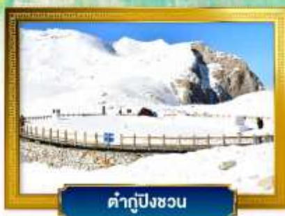
คำกู่ปิงชวบ