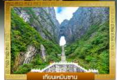
เทียนหนันซาน