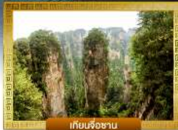
เทียนจื่อซาน