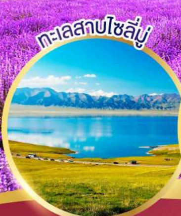
ทะเลสาบโซลุ่ม