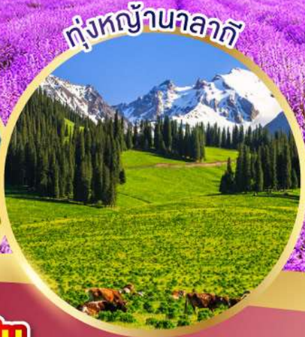
ทุ่งหญ้านาลากิ