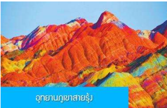
อุทยานภูเขาสายรุ้ง