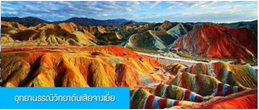
อุทยานธรณีวิทยาต้นเสี้ยวเจีย

วันที่สอง เมืองหลันโจว – นั่งรถไฟความเร็วสูงสู่เมืองจางเจีย – เที่ยวชมอุทยานธรณีวิทยาต้นเสี้ยว(ภูเขาสายรุ้ง)