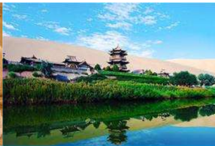
สระบัววังพระจันทร์