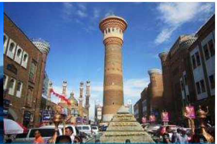
ตลาดต้าปาจา